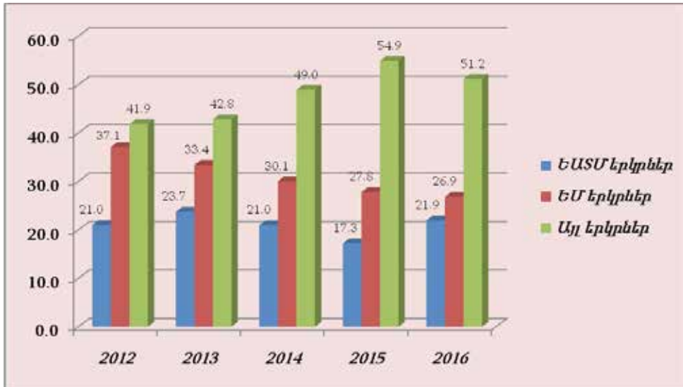
Գծապատկեր 1. ԵՄ, ԵԱՏՄ և այլ երկրների տեսակարար կշիռները ՀՀ արտահանման ընդհանուր ծավալի մեջ (%) 2

րունակում են կողմնորոշված մնալ առավելապես դեպի ԵՄ և այլ երկրներ (2016թ.-ի տվյալներով՝ Բուլղարիա՝ 8.5%, Վրաստան՝ 8.2%, Կանադա՝ 7.8%, Գերմանիա՝ 7.8%, Իրաք՝ 7.7%, Չինաստան՝ 5.4%, Իրան՝ 4.2%, Շվեյցարիա՝ 4.2%, ԱՄԷ՝ 3.6% և այլն՝)։