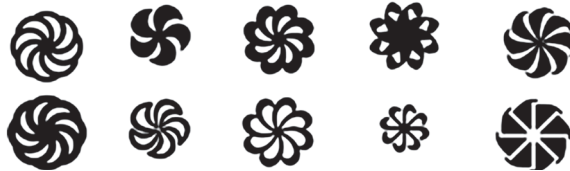
Նկար 1 Հայկական հավերժության սիմվոլ

Միննույն սիմվոլի այս տարբեր պատկերումները սիմվոլացնում են արևը, կյանքը, կրակը, կայծակը, պտղաբերությունը, ծննդաբերությունը, առաջընթացը, զարգացումը: Հոդվածը սիմվոլ հասկացության տեսական-մեթոդաբանական վերլուծության փորձ է: